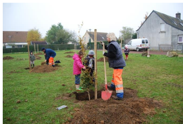
Plantations avec les écoles- Décembre 2013

La création de plus de 300 mètres de haies bocagères entre le bois du parcours santé, la piste cyclable le long de la route de l'hippodrome et l'Allée de Fontenailles, assure désormais la jonction entre les différentes zones arborées du secteur et une belle continuité de la trame verte dans ce secteur (voir photographie aérienne).