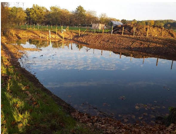
Mare de l'abri des quatre pattes après réhabilitation

Outre son intérêt pour le développement de la biodiversité, les mares favorisent l'écoulement naturelle des eaux de surface, forment des zones tampons en cas de crues et des réserves naturelles humides lors des épisodes de sécheresse (zone refuge pour les espèces des zones humides)